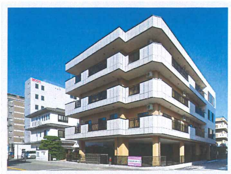
【特別養護老人ホーム 葦】

〒544-0015 大阪市生野区巽南3-7-30 TEL 06-6752-1339 (代表) FAX 06-6756-8839 OsakaMetro千日前線 南巽駅下車 3番出口より西へ200m 入所98床/ショートステイ16床 計114床 個室：36室/2人部屋：3室/4人部屋：18室